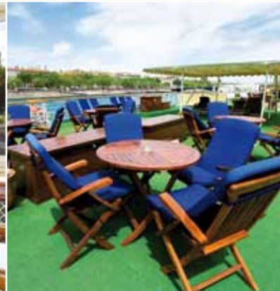
▼ Beispiel 2-Bett Oberdeck