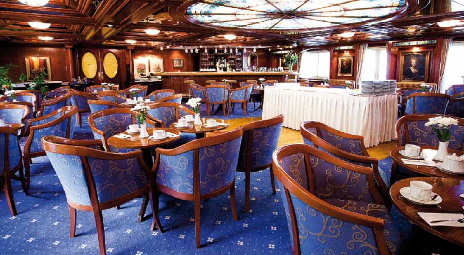
▲ Panoramasalon mit Bar